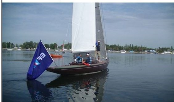
Les stagiaires de l'école de Voile ACAL STRASBOURG (67) découvrent un Lacustre, superbe quillard de sport de 1947, et son grand drapeau "EF Voile" qui lui donne des allures de Galion. Un vrai voyage dans le temps !

#Bravo à l'Aquatic Club d'Alsace et de Lorraine